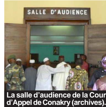
La salle d'audience de la Cour d'Appel de Conakry (archives).

Au cours de leur assemblée générale de ce mercredi 3 décembre, les hommes en robe ont décidé de fermer