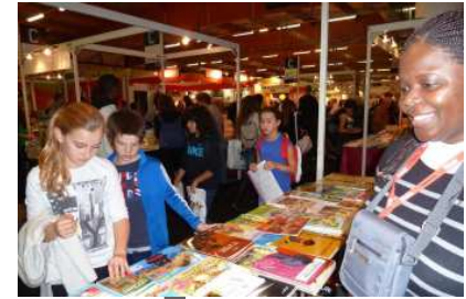
Une jeune lectrice à Montreuil