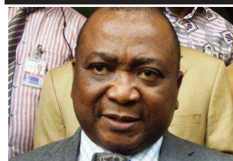
Le Ministre Oyé Guilavogui chassé à Kindia

Le Ministre d'Etat des télécommunications en séjour dans la préfecture de Kindia, a été chassé ce matin (vendredi 5 décembre 2014) par des citoyens de la localité de Friguigbé. Selon notre correspondant basé dans la région, il conduisait une mission de sensibilisation des populations aux mesures d'hygiène contre Ebola. http://afriquezoom.info