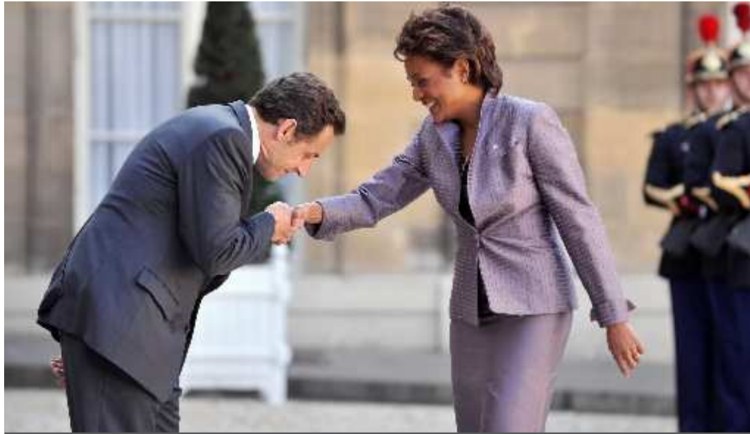
Les sympathisants de droite pensent que Sarkozy est mieux à même de gagner en 2017.

Première mission pour M. Sarkozy: « montrer les signes de rassemblement (...) L'UMP a un chef, il est incontestable, et en même temps, il y a