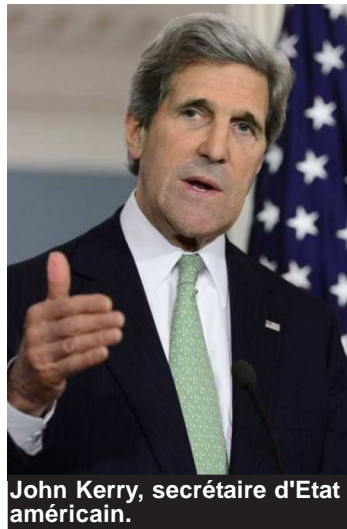
John Kerry, secrétaire d'Etat américain.

Nelson Mandela nous a quittés il y a aujourd'hui un an, et nous saluons la fin d'une vie exceptionnelle en même temps qu'un héritage qui continue de nous motiver tous. Il serait extrêmement difficile de trouver quelqu'un qui a touché autant de personnes que Nelson Mandela à l'échelle internationale. Il a exercé un ascendant considérable sur mon épouse Teresa, alors jeune étudiante en Afrique du